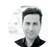
FRAN SILVESTRE FRAN SILVESTRE ARQUITECTOS